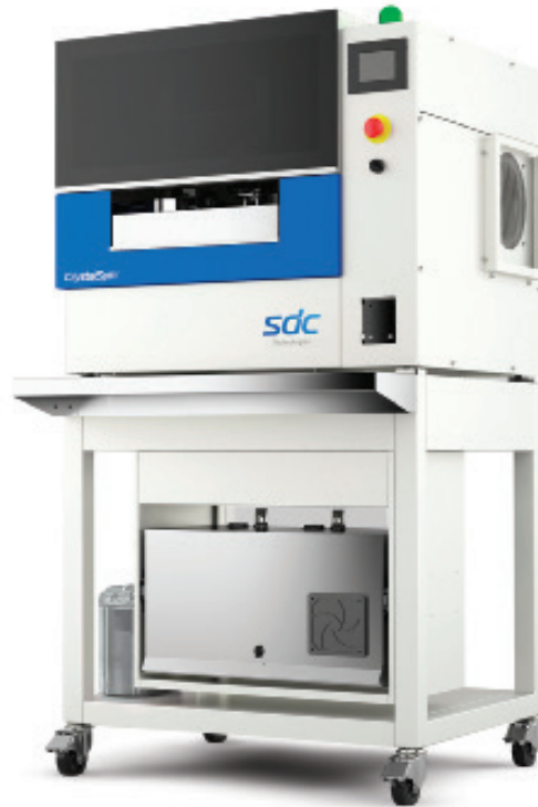
최신 코팅 시스템