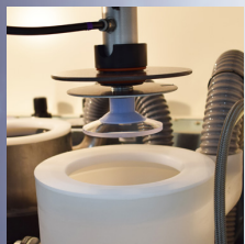
水洗いステーション