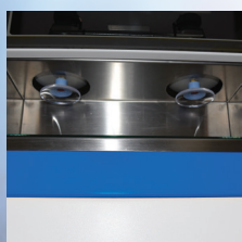
ローディングステーション